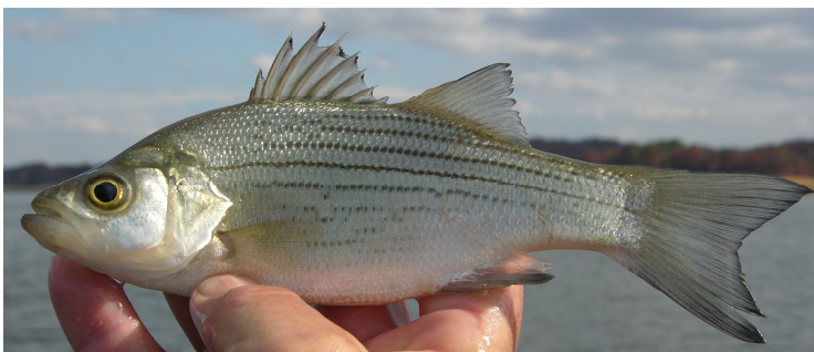
ホワイトバス M. chrysops