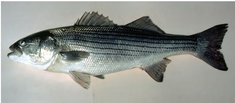
ストライプトバス M. saxatilis