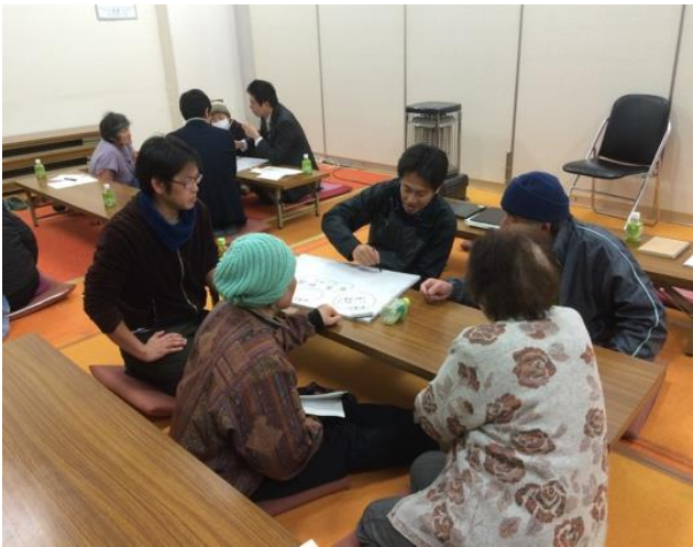
講演会後のワークショップの様子