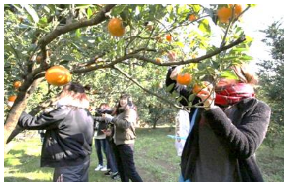
タンカン収穫体験(里めぐり)