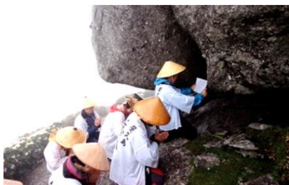
岳参りの様子(宮之浦岳)