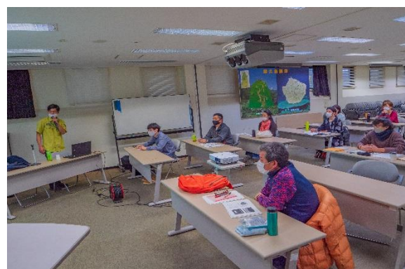
ガイドセミナーの様子