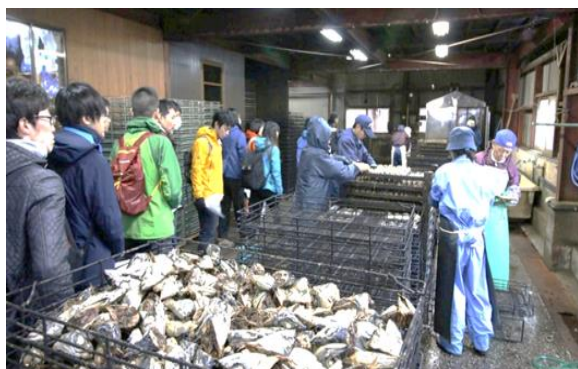
サバ節工場見学(里めぐり)