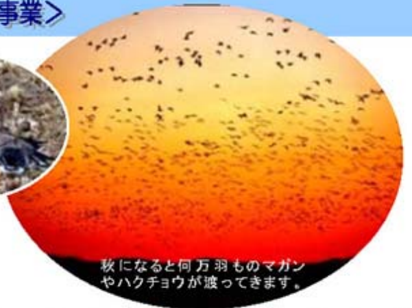
秋になると何万羽ものマガンやハクチョウが渡ってきます。