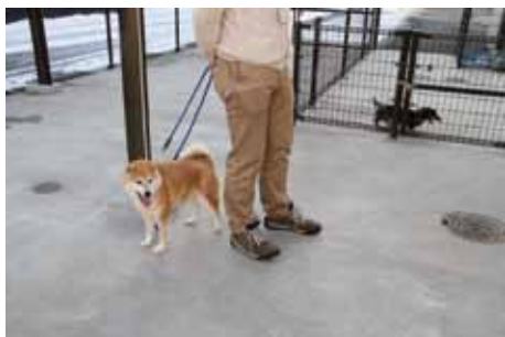
馴化ボランティア