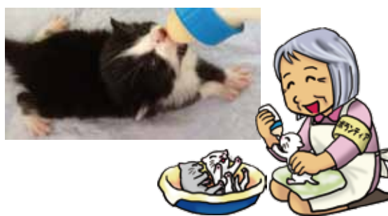
ミルクボランティア