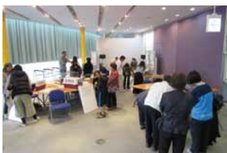
ボランティア講習会