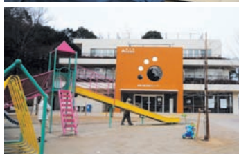
(上) 保護された犬たちは病気のチェックを(必要な場合はワクチンの接種も)受け、新しい家族を探す。(中) 骨折した猫のX線画像を確認。(下) 公園に隣接