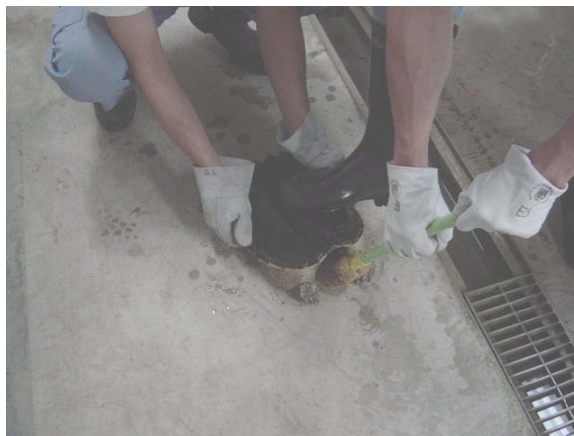
【器具を使用した保定法】

デッキブラシ等で威嚇し、甲羅の中に引っ込めた首をタオル等で甲羅のなかに押し込み、ガムテープ等で固定し、後足のすぐ上で背側甲羅の両側を保持する。