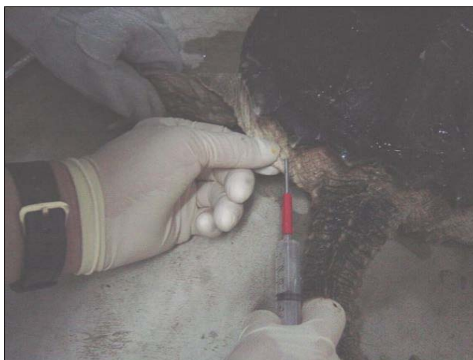
【マイクロチップ埋込み部位】