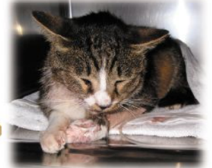
交通事故に遭った外飼いのねこ