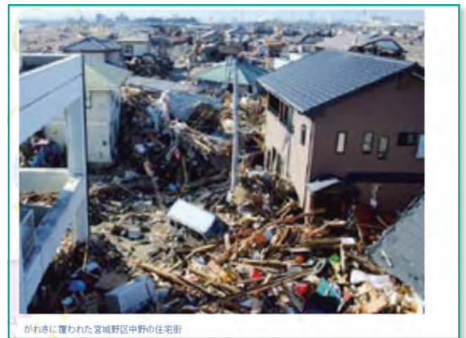
がれきに覆われた宮城野区中野の住宅街

ここがその近くの冒険広場というところです。この写真のようだったものが全てこのようになり、ここで5名ほど広場の展望台に避難の方がいらっやったということですが、その方はなんとか難を逃れたというお話です。