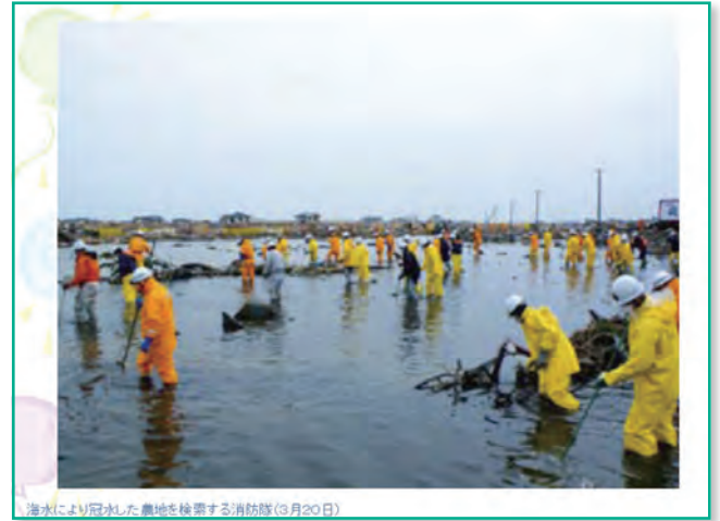
海水により冠水した農地を検索する消防隊(3月20日)

これは中央の白い建物が先程の荒浜小学校で、かつてどういう状態だったかというのがこちらの写真になります。松林が生い茂っていましたが全てなぎ倒されているのがよくわかります。