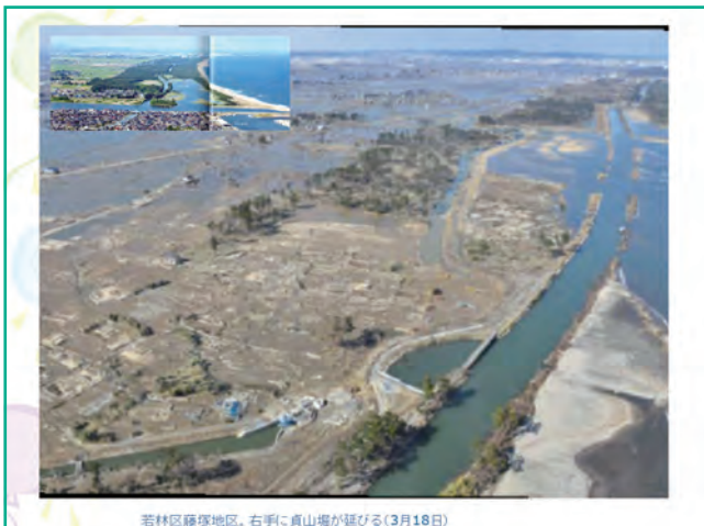
若林区藤塚地区。右側に青山塚が聳(3月18日)

そして、ここは藤塚というところで、ここが閉上ですが、全て無くなっている様子がわかると思います。