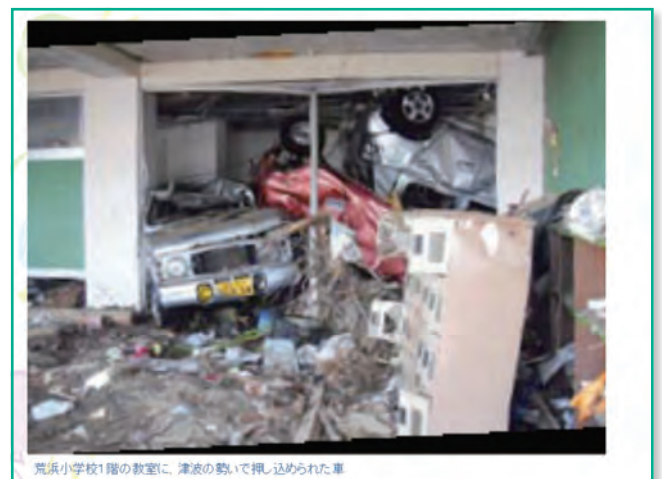
荒浜小学校1階の教室に、津波の勢いで押し込められた車

そして、ここは藤塚というところで、ここが閉上ですが、全て無くなっている様子がわかると思います。