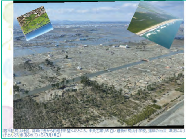
若林区荒浜地区。海岸付近から内陸部を望んだところ。中央右寄りの白い建物が荒浜小学校。海岸の松は、津波によりほとんどなぎ倒されている(3月18日)

これは中央の白い建物が先程の荒浜小学校で、かつてどういう状態だったかというのがこちらの写真になります。松林が生い茂っていましたが全てなぎ倒されているのがよくわかります。