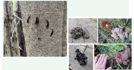
食べたもの：（上段左から）黒こば、クリ （下段左から）サクラの実、カキ 「美の国あきたネット ツキノワグマ情報」より