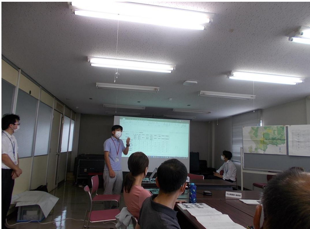
図3 モニタリング及び対策実施状況の共有

一方で、丹南地域では市町をまたいで分布する群れが複数存在していたが、それぞれの市町がそれぞれで調査・対策を実施している状態であったため、非効率な管理となってしまっている側面もあった。そこで関係5市町と福井県で構成される「丹南地域有害鳥獣対策協議会」の中で、市町間でのサルに関する知識の充実を図りつつ、モニタリングや対策の現状について共有する場を設けることとなった。5市町のサル事業に関わってきた立場として、私が研修会の講師を担うこととなった。研修会の内容は、サルの生態や必要なモニタリング、被害対策の考え方など基本的な内容から始まり、これまで各市町が実施してきたモニタリング内容を取りまとめ、現状の整理と今後の管理方針の提案もおこなった。この動きは、現在でも継続している。