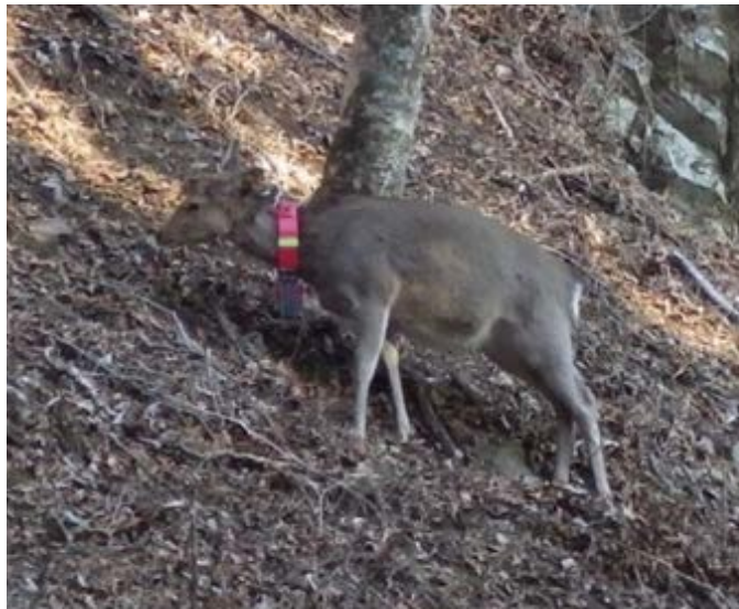
写真1 GPS首輪を装着後放獣したシカ

ニホンジカの行動特性調査の結果を踏まえて、特に冬季に標高の高い地域を利用する個体の増加に合わせ、高標高地域に生育する脆弱な植生に対して早急に適切な対策を講じることが必要と考えられ、管理計画策定検討委員会において提言を行った。