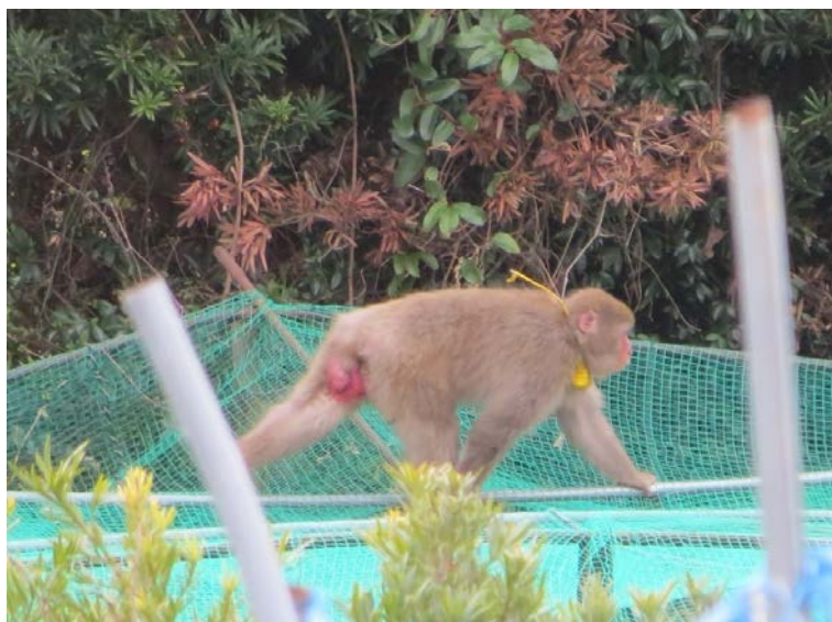
写真1 GPS発信器首輪を装着したサル