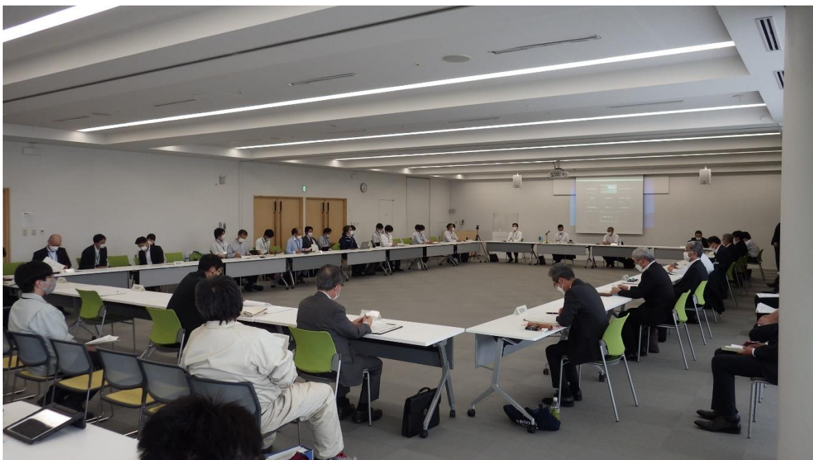
図1 避難12市町村鳥獣被害対策会議

市町村が福島県二ホンザル管理計画に基づき定める事業実施計画の策定を支援した。打合せを重ね、生息状況の把握方法や重点的に対策を行うべき群れ等について、助言した。