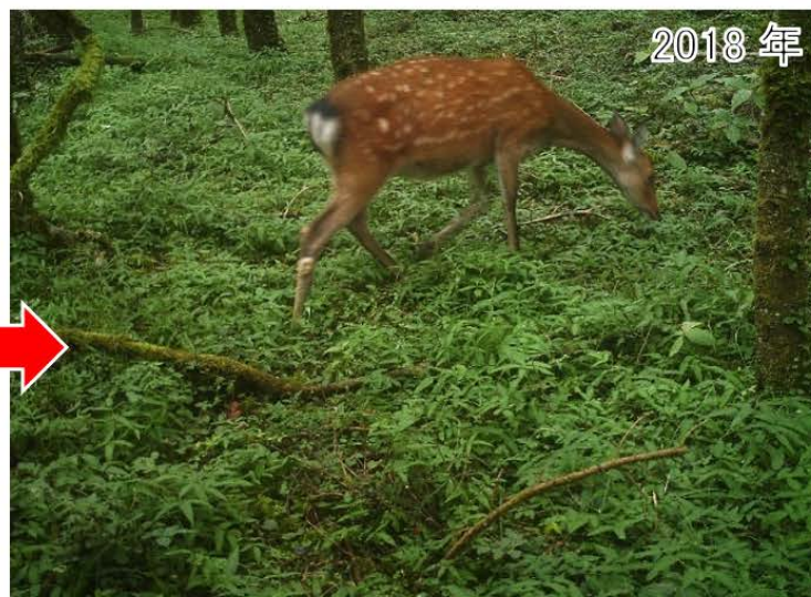
写真1 2013年8月、2018年9月の森林の状況（同一地点）