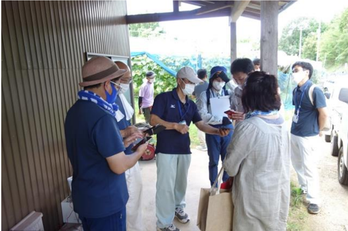
図3 グループLINEの立ち上げと使用方法の説明