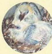
ベランダにつくられたハトの巣

ハトはベランダや建物の隙間に巣を作ります。 巣のまわりはよごれ、ダニやハエが発生します。