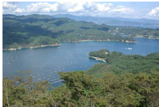
MOUNEWAN viewed from Kameyama garden 亀山園地から見た舞根湾