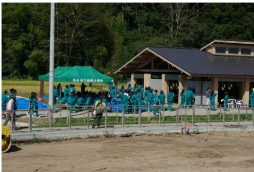
A gazebo constructed on TANAKAHAMA 田中浜に整備した四阿

The itinerary might be changed due to bad weather. コースについては、天候等により変更する場合があります。 Bring raingear when forecast is not good. 雨などが想定される場合、雨具を持参してください