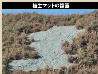
植生マットの設置