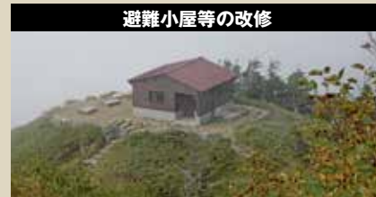
避難小屋等の改修