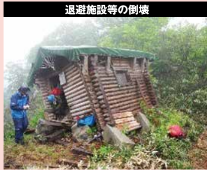
退避施設等の倒壊