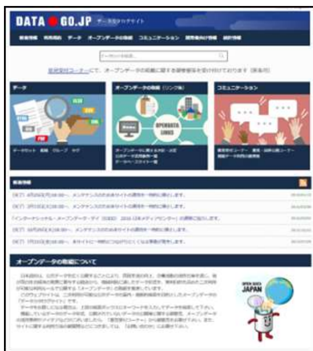
図 0, 「DATA. GO. JP」のキャプチャ画像

本文書では、環境省が保有するオープンデータの情報を政府が運用するオープンデータのポータルサイト「データカタログサイト DATA.GO.JP（ http://www.data.go.jp/ ）」に掲載及び更新情報を反映させるための検索用情報のデータ（以下「メタデータ」）における作成手順について説明します。