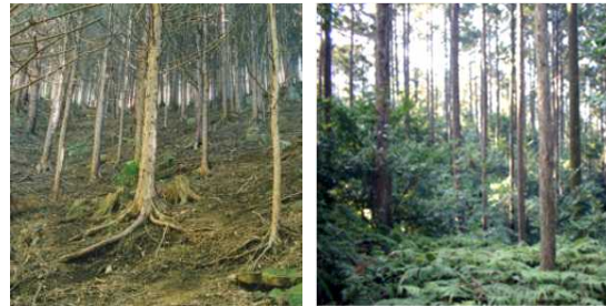
間伐等の適切な森林整備