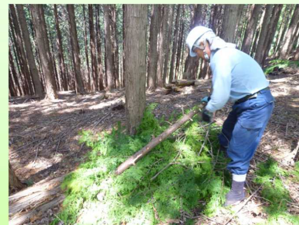
福島県有林での実施状況