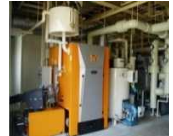
熱供給施設等での利用