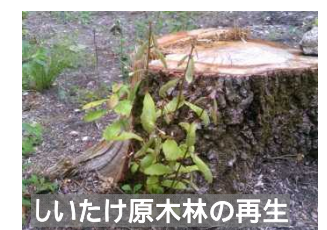
しいたけ原木林の再生