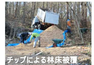
チップによる林床被覆