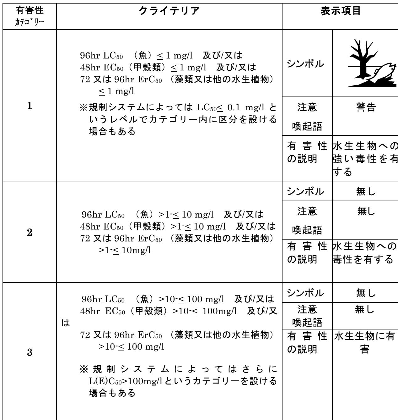
図 4. 1 水生環境 急性毒性