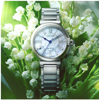
シチズン エル最新モデル

時計材料の調達から廃棄・リサイクルに至るまでのライフサイクル全体を通して排出されるCO2をカーボンフットプリントとして公開