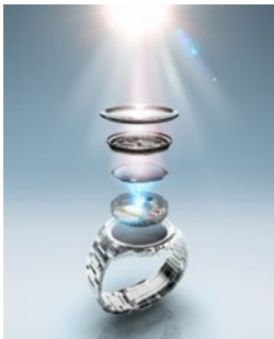
光発電エコ・ドライブを搭載