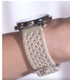
回収ペットボトルから再生された繊維をバンドに利用