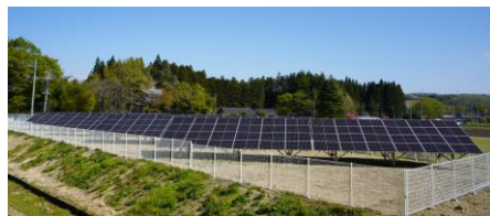
自家消費型PV発電所

○内容に関する情報ページURL 業務紹介 | 宮城衛生環境公社 (miyagi-ek.co.jp)