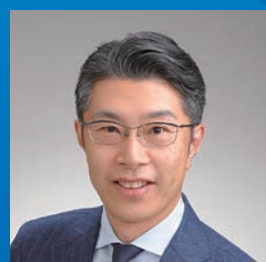
CSRデザイン環境投資顧問株式会社 代表取締役社長