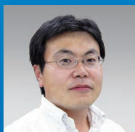
株式会社りそな銀行 アセットマネジメント部 責任投資グループ グループリーダー