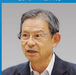
国連環境計画金融イニシアチブ 特別顧問