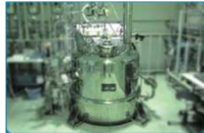
<バイオマスプラスチック製造設備>