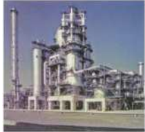
<石油精製所を活用したリサイクル設備>