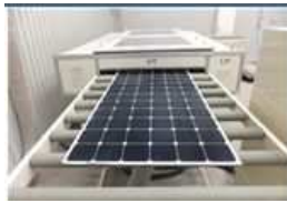
<太陽光発電設備リサイクル設備>