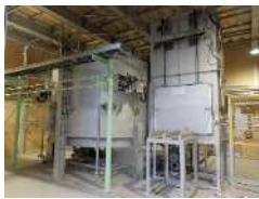
<Li-ion電池リサイクル設備>