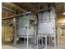
<Li-ion電池リサイクル設備>