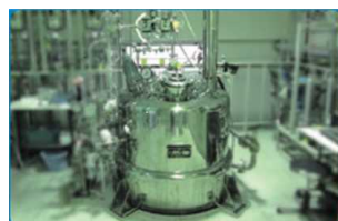
<バイオマスプラスチック製造設備>