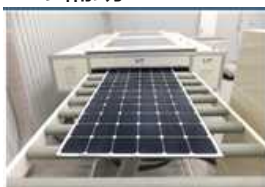
<太陽光発電設備リサイクル設備>