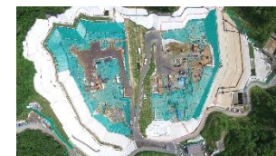
特定廃棄物埋立処分場