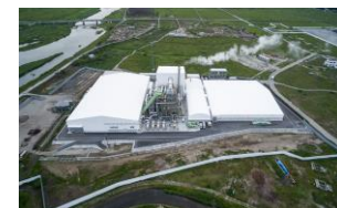
浪江町 仮設焼却施設