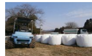
農林業系廃棄物(稲わら、牧草等)