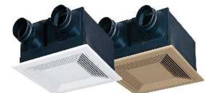
高効率換気設備 イメージ