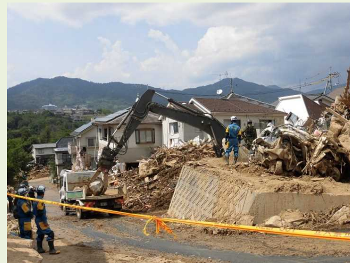
③ 損壊した家屋等の解体、 がれきの収集・運搬及び処分