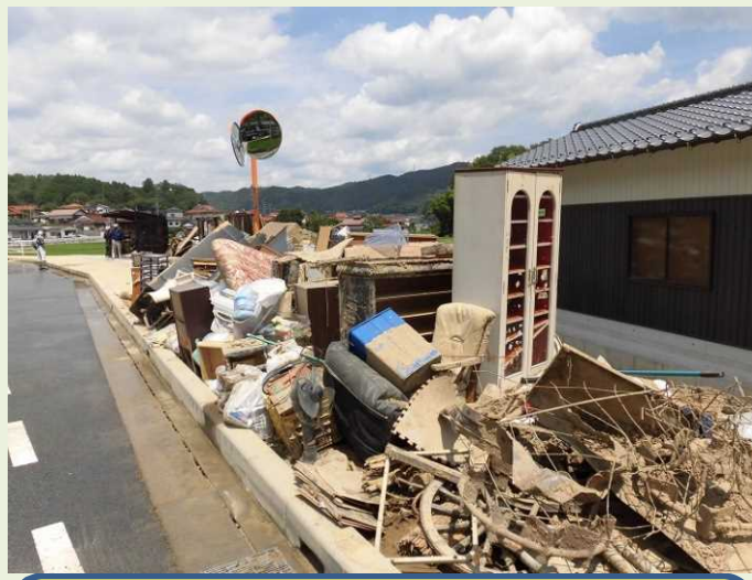
② 片付けごみの 収集・運搬及び処分