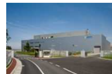
北海道（室蘭）事業所