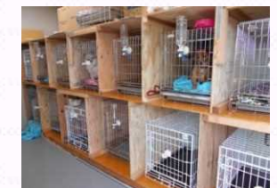
避難所におけるペット飼育スペース