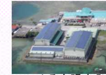
JCMによる太陽光発電の導入(パラオ)