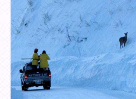
知床におけるシカの捕獲