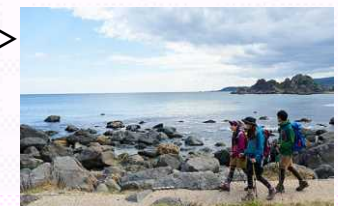
三陸復興国立公園等における「みちのく潮風トレイル」の取組