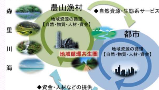
自然の恵みの活用を通じて都市と地域が支えあう仕組み