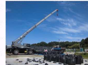
除去土壌等の搬出の様子