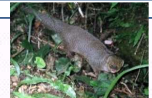
侵略的な外来種マングース