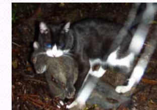
アマミノクロウサギを捕食するノネコ