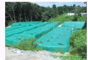
指定廃棄物(農林業系廃棄物)の保管状況