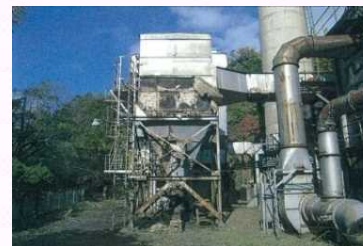
老朽化した廃棄物処理施設の更新