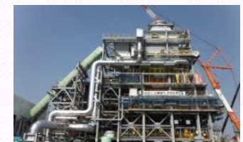
仮設焼却炉の建設状況(対策地域内廃棄物)