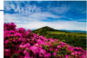
魅力的な展望地整備とITを活用した解説案内