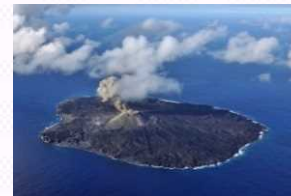
西之島の火山活動の様子 (2015.11.17)