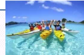
満喫ツアーコンテンツの発掘・磨き上げなど

8箇所の国立公園において、インバウンド対応に向けて、ユニバーサルデザインにも配慮しつつ、ビジターセンターの改修やビューポイントの整備、ツアーコンテンツの発掘・磨き上げ、ガイド等の人材育成、効果的な情報発信等を行う。