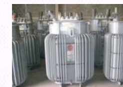
PCBが含まれる 高圧トランス