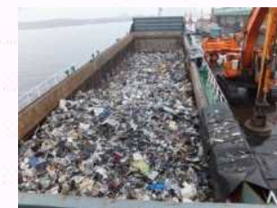
廃棄物の不法輸出