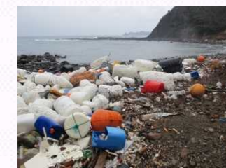
対馬における漂着ごみの状況