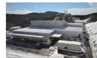
飯館村蕨平地区 仮設焼却施設 (平成28年1月)

● 仮設焼却施設 (建設工事中を含む) □ 汚染廃棄物対策地域 □ 避難指示解除準備区域 ■ 居住制限区域 ■ 帰還困難区域