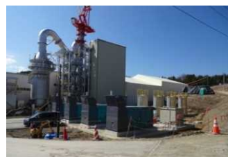
葛尾村の仮設焼却施設 (平成27年4月)