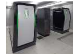
高解像度処理・アルゴリズム開発