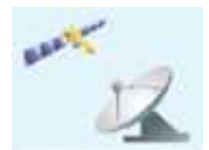
データ受信記録設備 運用系システム