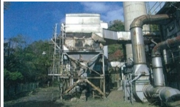
老朽化して休止した処理施設