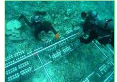
【西表石垣国立公園】自然再生事業