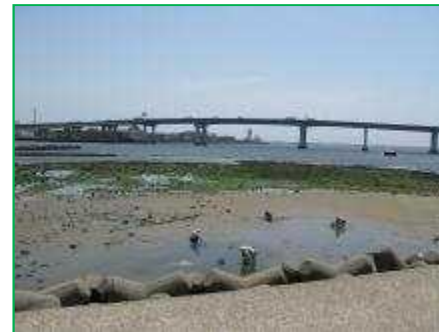
【国指定浜甲子園鳥獣保護区】保全事業