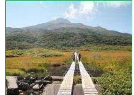
【鳥海国定公園】木道整備