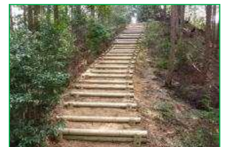
【東海自然歩道】登山道整備