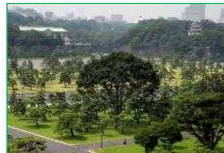
【皇居外苑】苑地維持管理