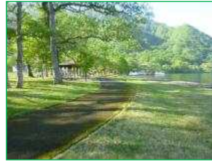
【十和田八幡平国立公園】園地整備