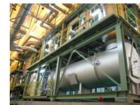
福島市・堀河町終末処理場 下水汚泥仮設減容化施設