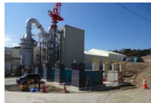
葛尾村の仮設焼却施設 (平成27年4月)