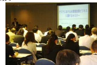
アジア水環境改善ビジネスセミナー (H26.5.13 於東京、約120名が参加)