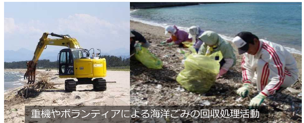
重機やボランティアによる海洋ごみの回収処理事業