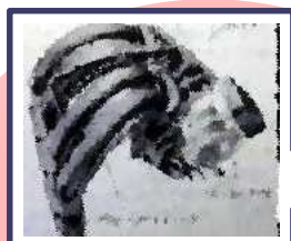
エンジン部材等 バイオプラ（高耐熱）