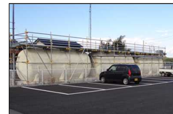
【応急仮設住宅に設置された浄化槽】