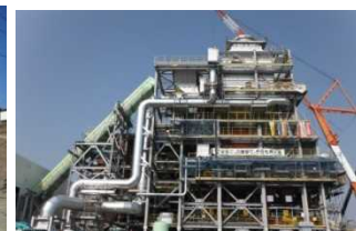
浪江町の仮設焼却施設 (平成27年4月)