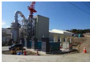
葛尾村の仮設焼却施設 (平成27年4月)