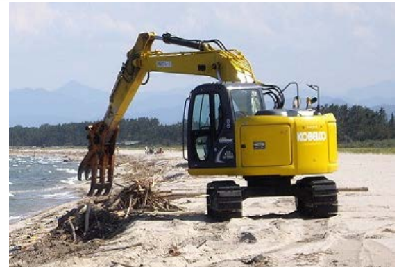
重機による海洋ごみの回収処理事業活動