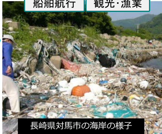
長崎県対馬市の海岸の様子