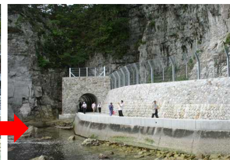
被災施設の復旧整備、供用開始 (浄土ヶ浜海岸歩道)