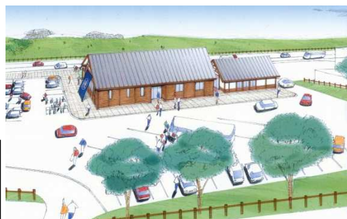
公園編入地域の集団施設地区整備 (整備イメージ)