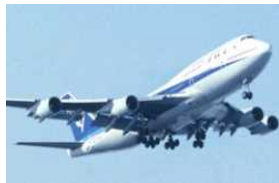
旧環境基準と新環境基準の調査結果の比較により、測定・評価方法の妥当性を検証