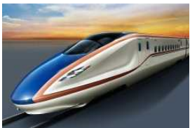
北陸新幹線開業、東海道新幹線の速度向上(いずれもH27.3)に伴う騒音・振動測定