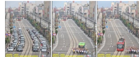
富山県高岡市