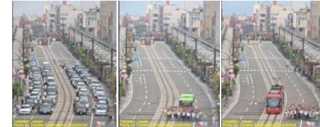
富山県高岡市