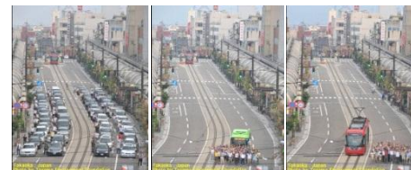
富山県高岡市