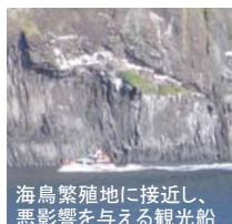
海鳥繁殖地に接近し、 悪影響を与える観光船