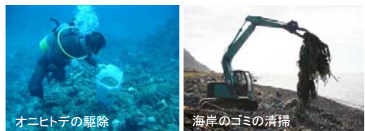
オニヒトデの駆除