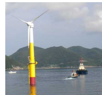
H24年6月に実証海域に設置した小規模試験機