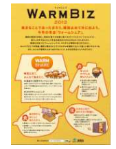
(あったか忍者【あった丸】)