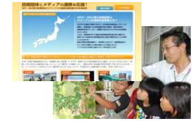
(草牟田小学校のグリーンカーテン)